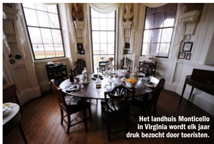
Het landhuis Monticello in Virginia wordt elk jaar druk bezocht door toeristen.