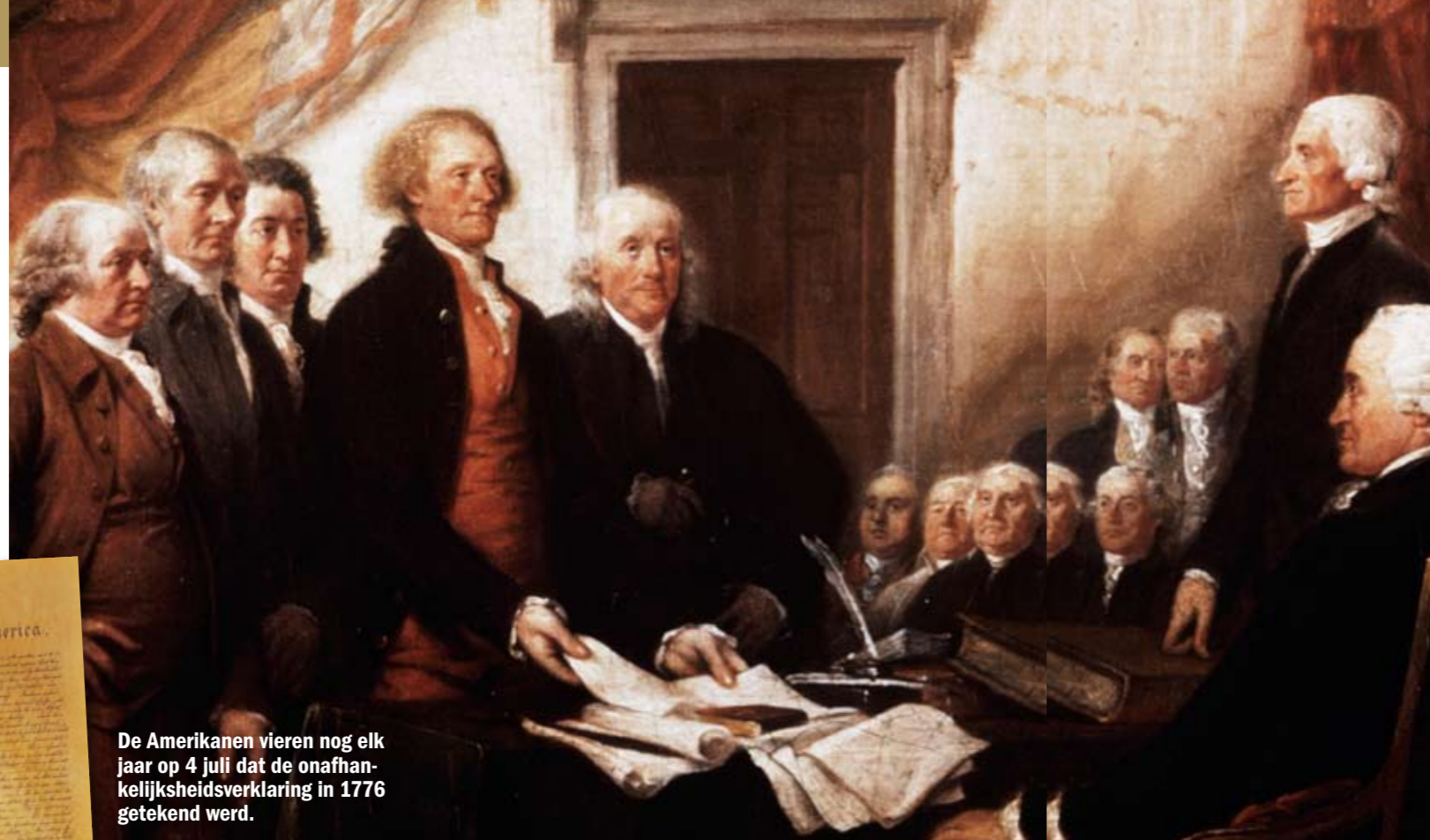
De Amerikanen vieren nog elk jaar op 4 juli dat de onafhankelijkheidsverklaring in 1776 getekend werd.